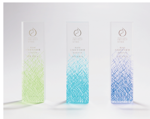
分野により色の異なるトロフィー