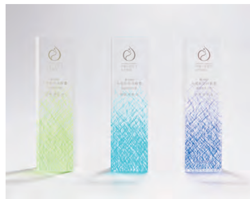
分野により色の異なるトロフィー